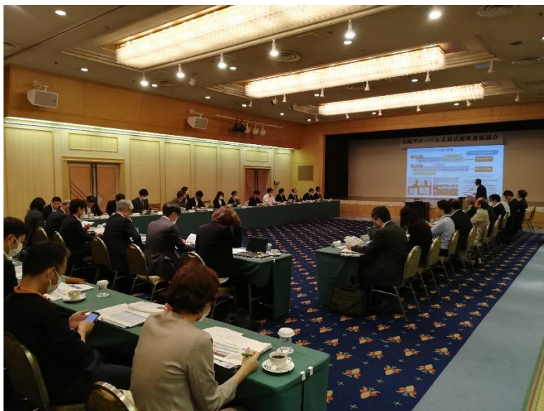
長岡グローバル人材活躍推進協議会（令和5年5月31日開催）

高度外国人材を長岡市に呼び込み、市内企業の成長と国際競争力の強化を後押しするため、令和元年7月にグローバル人材活躍推進協議会を設立。